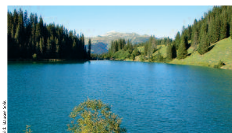
Bild: Stausee Solis

Anmeldung: Bis 3. Mai 2010 an fez@forum-energie.ch. über www.forumenergie.ch . Die Teilnehmeranzahl ist auf 30 Personen beschränkt. First come, first serve